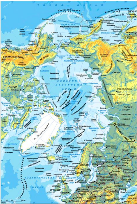
Рис. 1 – Современная физическая карта Арктики

Нумерация рисунков сквозная по всей работе. Например: Рис. 2 (второй рисунок). Пример оформления рисунка: