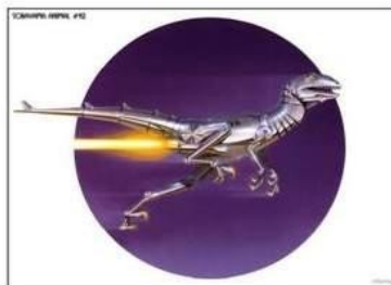
Рис. 2. Правый