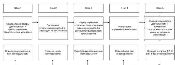
Рис. 1. Процесс стратегического управления

Описание ситуации. На рисунке представлен процесс стратегического управления.