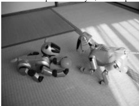
Две собачки AIBO разных моделей — ERS-210 (слева) и ERS-111 (справа)

На чемпионате среди роботов RoboCup между перепрограммированными AIBO устраивались футбольные матчи. Также роботы AIBO использовались в эксперименте, результатом которого стала научная публикация «Социальное поведение собак при встрече с собакоподобным роботом AIBO в нейтральной ситуации и во время кормления».