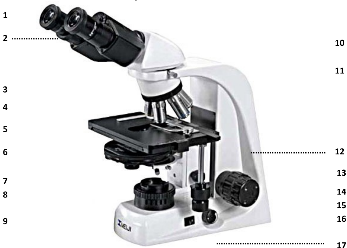
Рис. Микроскоп биологический (MeijiTechno TM 4200L (Япония))