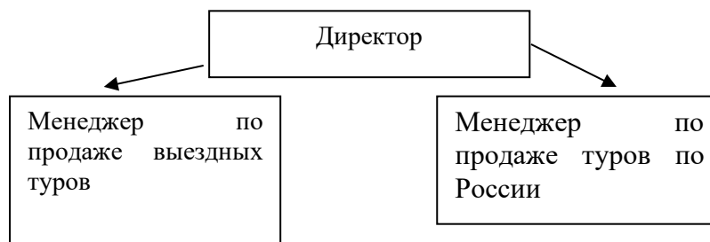
Рис. 1 – Организационная структура туристского предприятия