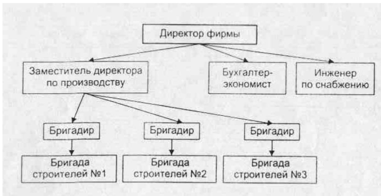
Рис. 1. Структура управления малой фирмой «Строитель»

По приведенным структурам управления предприятиями установите, к какому типу структур они относятся. Дайте развернутое обоснование.