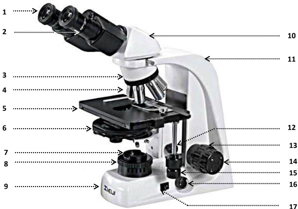
Рис. Микроскоп биологический (MeijiTechno TM 4200L (Япония))