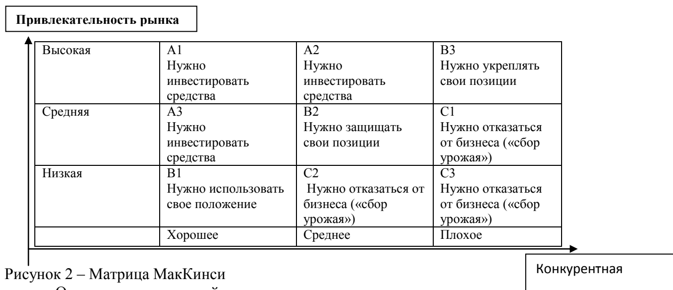
Рисунок 2 – Матрица МакКинси

Оценка конкурентной позиции организации и привлекательности отрасли производится с использованием экспертно-балльных методов оценивания. В ходе оценки выявляется перечень факторов, наилучшим образом характеризующих конкурентную позицию компании с учетом отраслевой специфики, каждому фактору присваивается вес и балльная оценка интенсивности проявления фактора в организации по шкале от 1 до 5 (табл. 16).