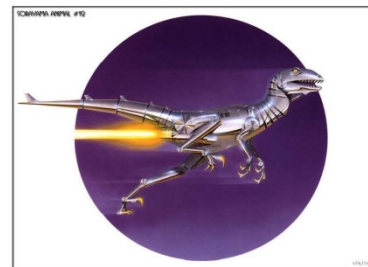
Рис. 2. Правый